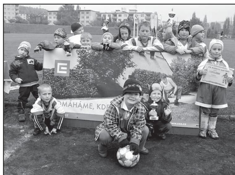
Dne 22. října 2011 se uskutečnil na fotbalovém hřišti FK Kláštec nad Ohří turnaj přípravek. Partnerem této akce byla „Skupina ČEZ“.